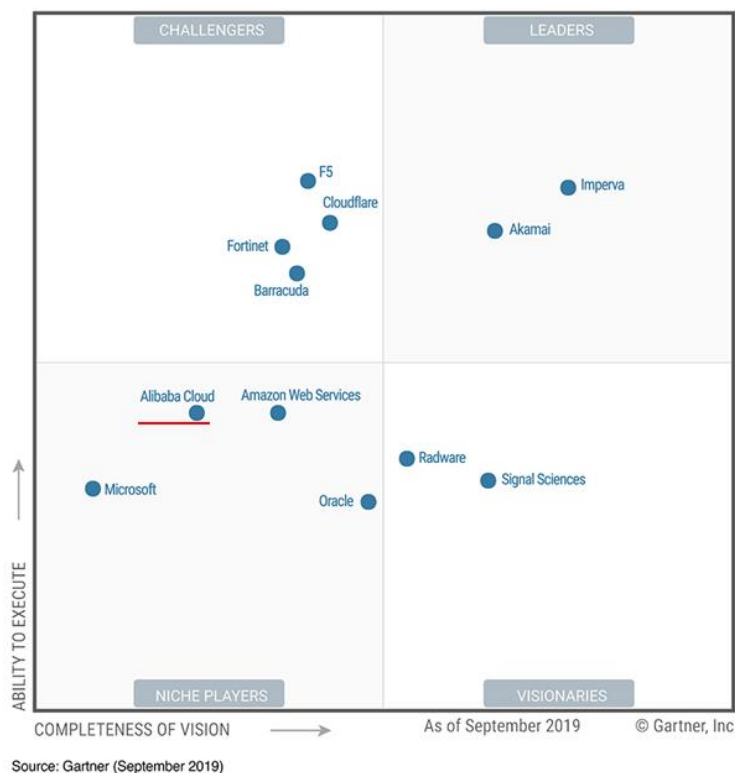
Figure 1. Magic Quadrant for Web Application Firewalls

我们测试了阿里云 WAF、华为云 WAF、腾讯云 WAF 和京东云 WAF，并计划测试微软云 WAF 和亚马逊云 WAF，从简单易用来看，国产云 WAF 服务完胜国外云 WAF 服务。虽然后两家巨头的云 WAF 服务也提供了免费测试，但是由于不知道如何下手而放弃，不像国内厂商基本上都是一键搞定。